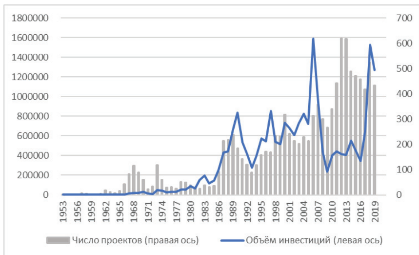
Рис. 1. Динамика прямых инвестиций японских компаний на Тайване (объем инвестиций в млн долл. США и число проектов)

соседние страны. В послевоенный период можно выделить несколько этапов расширения предпринимательской деятельности японских компаний в Восточной Азии.